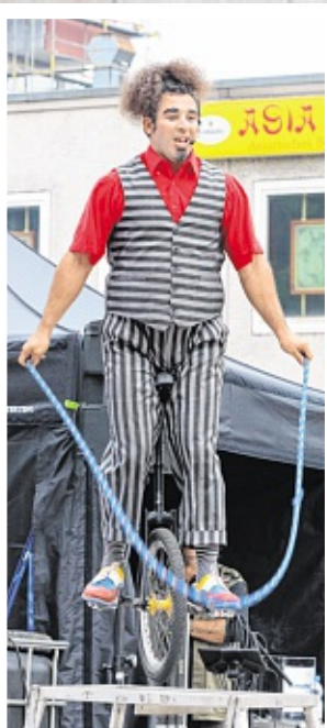
Mit einem Einrad auf einem Podest Seilspringen – für Circo Eguap eine einfache Übung.